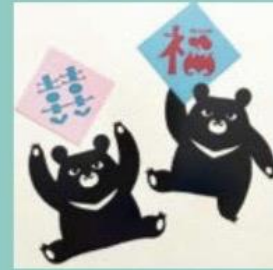
上野 文緒 うえの ふみお

台湾の書籍で中国西北地方の民間切り紙に出会い、2010年頃から独学にて中国切り紙の制作を始める。伝統的な赤い切り