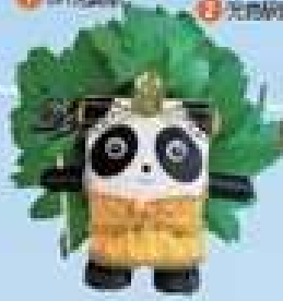
9 フランシアンパーク 見島山ハイランド