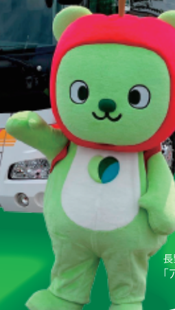
長野県PRキャラクター「アルクマ」©長野県アルクマ